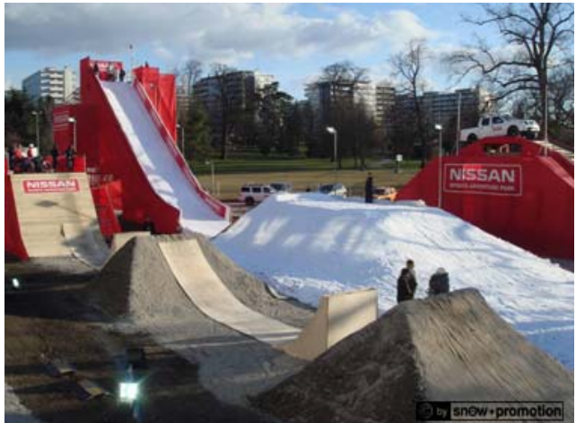
Rampenverkleidung "NISSAN", Genfer Autosalon, Genf