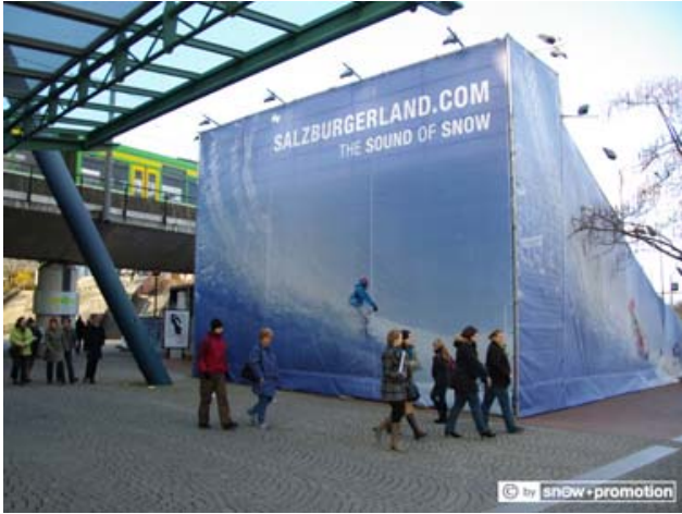
Rampenverkleidung "SalzburgerLand", Centro Winterwelt, Oberhausen