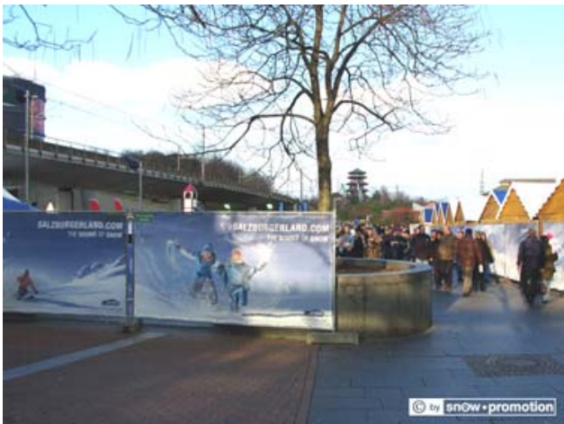
Sichtschutz "SalzburgerLand", CentroO Weihnachtsmarkt, Oberhausen