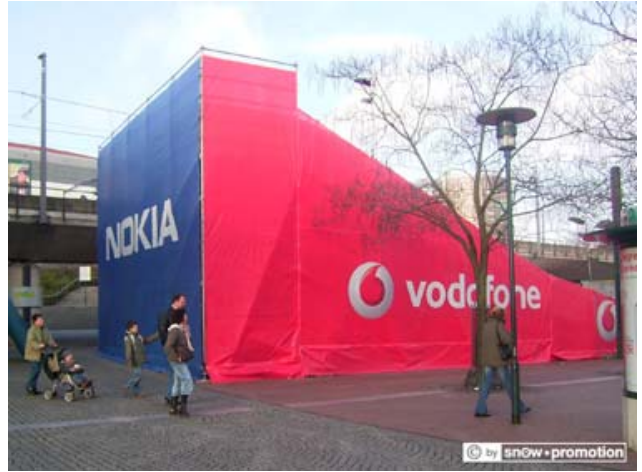
Rampenverkleidung "NOKIA/VODAFONE", Centro Winterwelt, Oberhausen