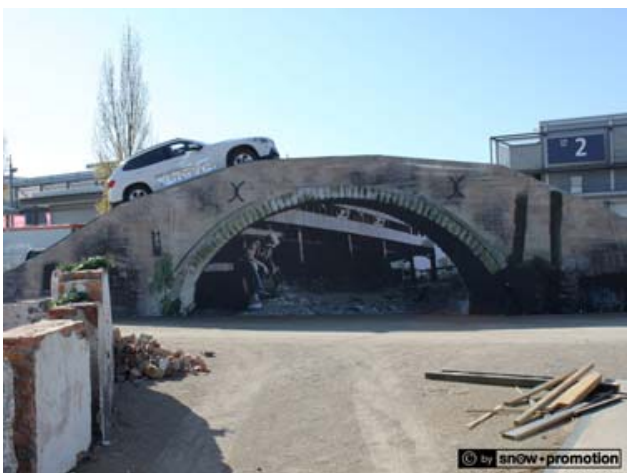
Verkleidung Outdoorparcours, Automobilmesse AMI, Leipzig