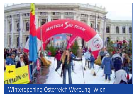
Winteropening Österreich Werbung, Wien