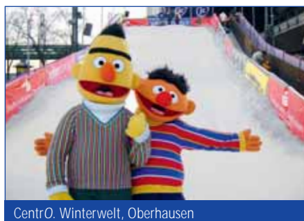
CentrO. Winterwelt, Oberhausen