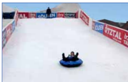
Winteropening Österreich Werbung, Kattowicz