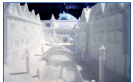
Schnee- und Eisskulpturenfestival, Oberhausen