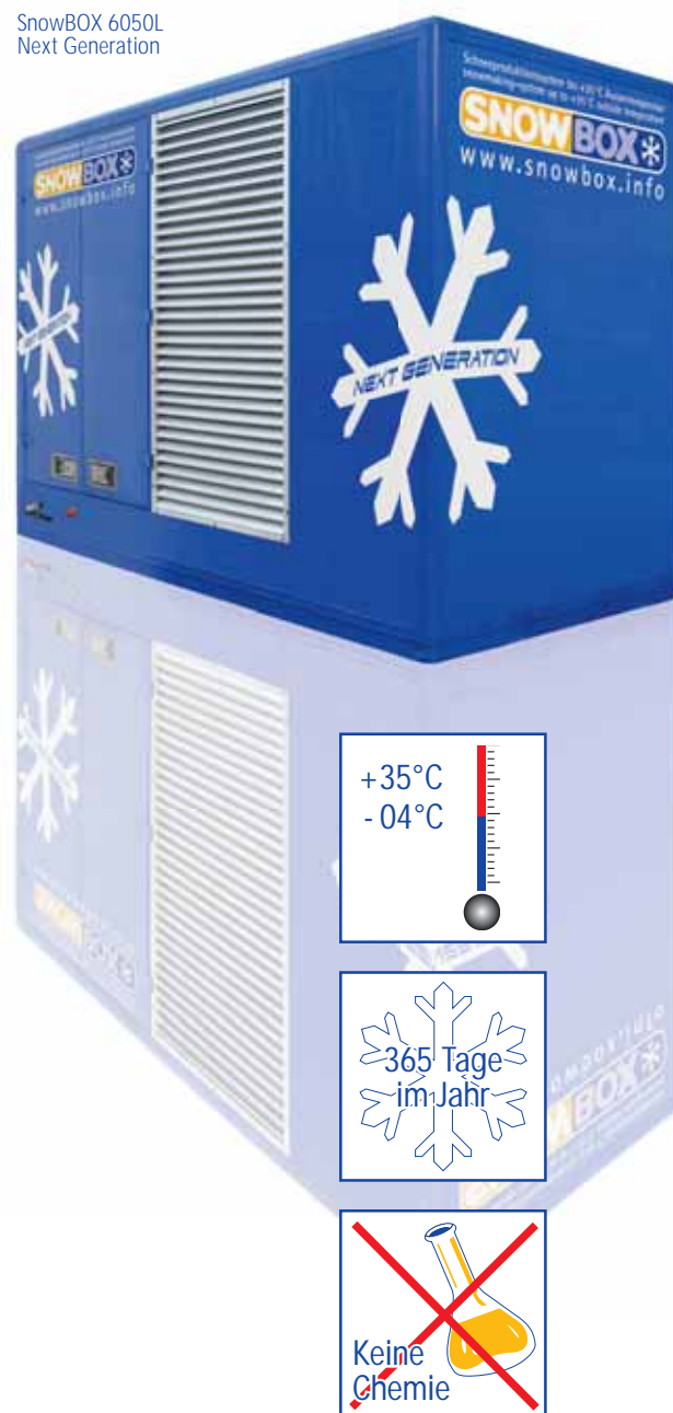
SnowBOX 6050L Next Generation

Die Leistungsfähigkeit dieses Schneeproduktionssystems liegt je nach Maschinentyp von 20m 3 bis zu 100m 3 Schnee pro Tag. Als spezielle Festinstallation für Wintersportarenen ist mit der SnowBOX Factory eine Tagesleistung zwischen 200-2.000m 3 möglich. Hohe Flexibilität und Mobilität, einfache Handhabung und hohe Energieeffizienz sind die herausragenden Eigenschaften der SnowBOX Schneemaschinen. Individuell angepasste Anlagen sind auf Anfrage erhältlich.