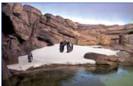
Pinguinhaus, Zoo Berlin