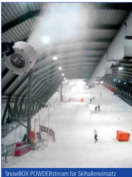
SnowBOX POWDERstream für Skihalleneinsatz

Ökonomische Beschneigung für beste Pistenverhältnisse