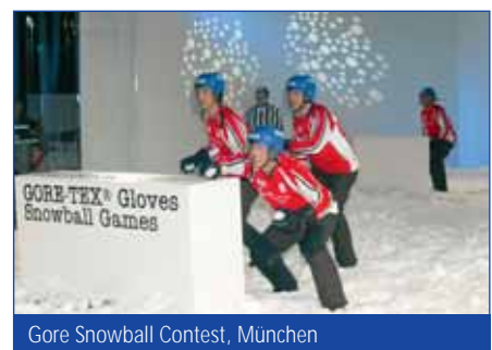
Gore Snowball Contest, München