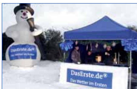
ARD Weihnachtswetter, Neuss