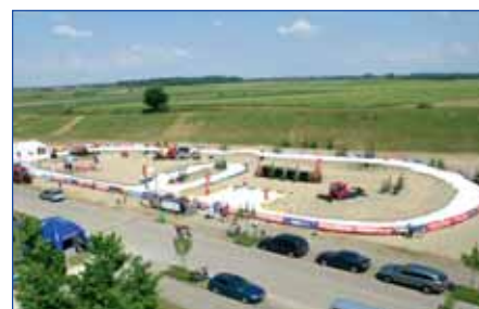
Pistenbully Biathlon, Laupheim