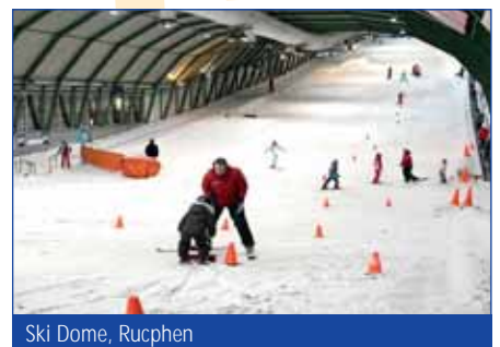
Ski Dome, Rucphen