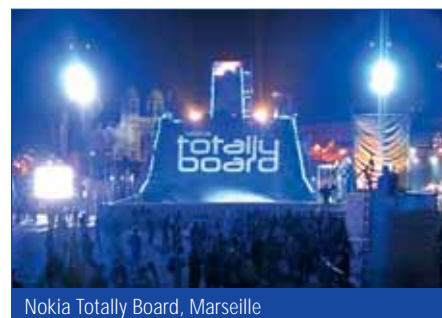
Nokia Totally Board, Marseille