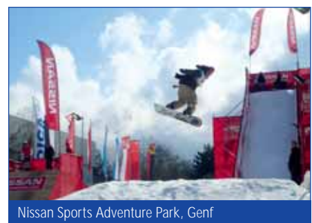
Nissan Sports Adventure Park, Genf