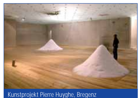
Kunstprojekt Pierre Huyghe, Bregenz