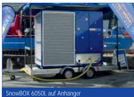
SnowBOX 6050L auf Anhänger

*Dieser Wert berücksichtigt die effektive Kälteenergie des SnowBOX-Schnees im Vergleich zu präpariertem Naturschnee (=Schmelzdauer). Alle Angaben können je nach Aufstellungsbedingungen, Witterung, Seehöhe und Wasserqualität schwanken. Die in den technischen Daten angegebenen Werte beziehen sich auf einen Messtemperaturbereich von 10-20°C. Irrtümer und technische Änderungen vorbehalten. Stand 06/2009