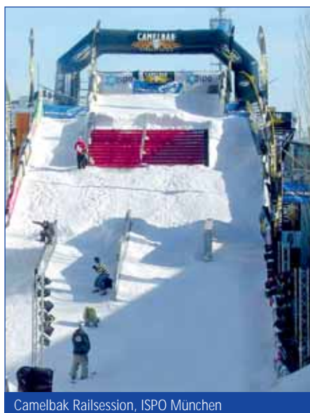
Camelbak Railsession, ISPO München