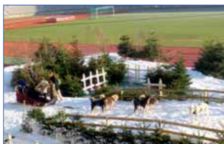
Charléty sur la neige, Paris