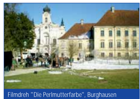
Filmdreh "Die Perlmutterfarbe", Burghausen