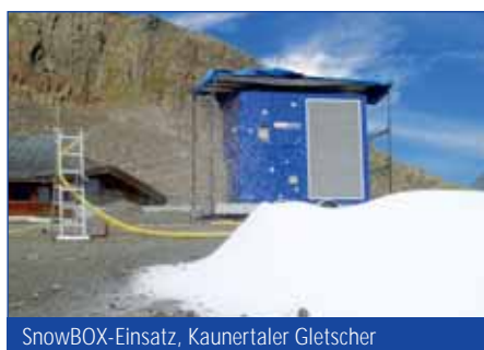
SnowBOX-Einsatz, Kaunertaler Gletscher