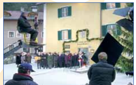
ORF TV-Produktion "Klingendes Österreich"