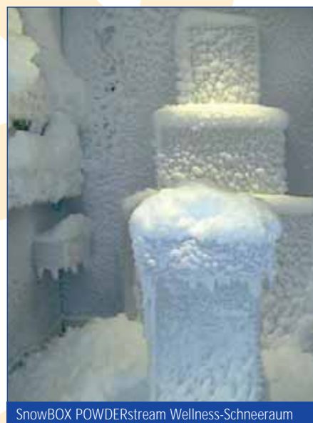
SnowBOX POWDERstream Wellness-Schneeraum