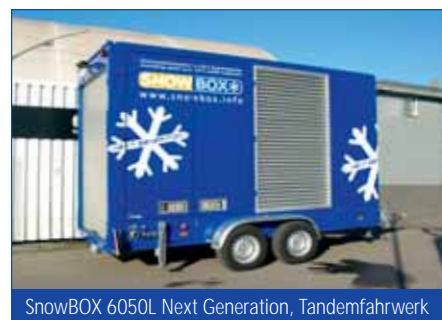
SnowBOX 6050L Next Generation, Tandemfahrwerk