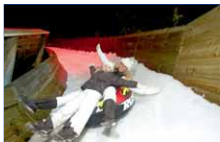
Rodelbahn, Zoo Hannover