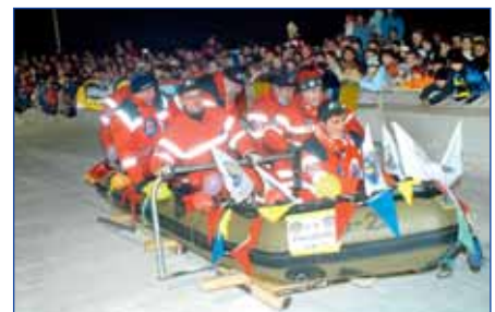
Antenne Bayern Party Piste, Bayern