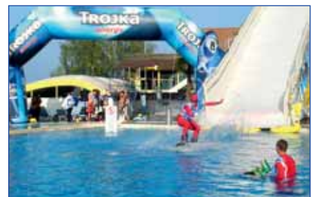
ALPAMARE Watersliding Contest, Pfäffikon