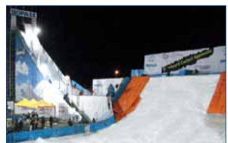
Skipass Modena, Modena