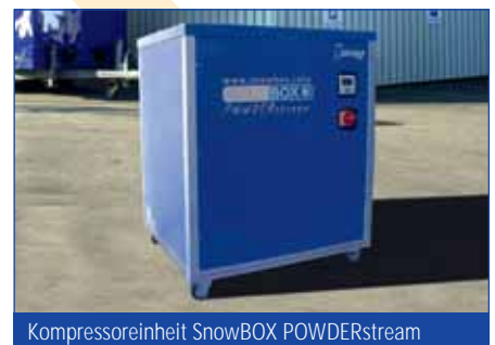
Kompressoreinheit SnowBOX POWDERstream