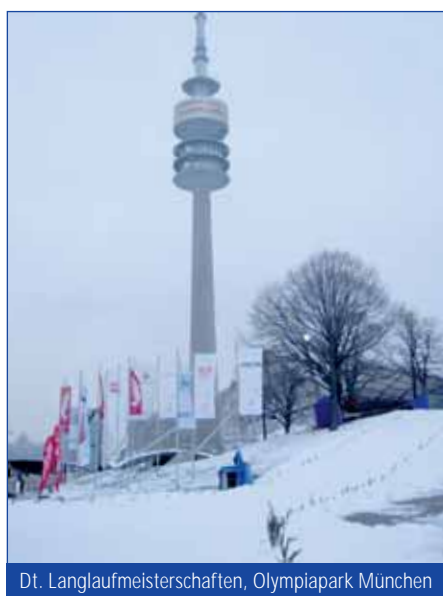
Dt. Langlaufmeisterschaften, Olympiapark München

Skigebiete entwickelt: die SnowBOX 200 - 2.000m 3 Schnee pro Tag ganze Jahr beschneit und die optimal zur Beschneigung Durch die Schaffung bietet sich den