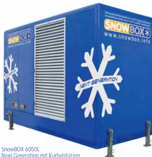
SnowBOX 6050L Next Generation mit Kurbelstützen