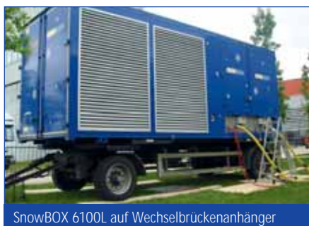
SnowBOX 6100L auf Wechselbrückenanhänger