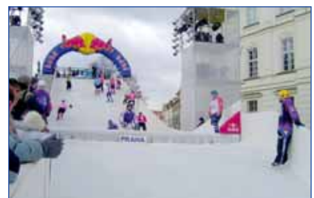
Red Bull Crashed Ice, Prag