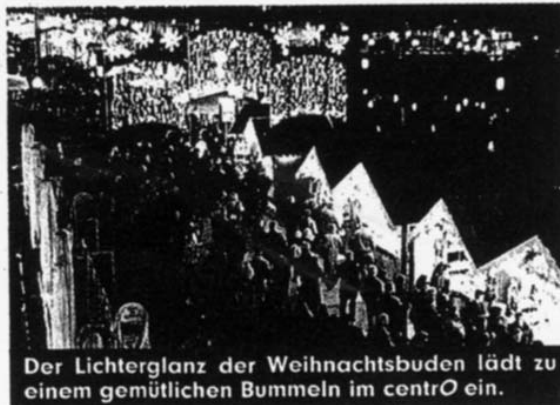
Der Lichterglanz der Weihnachtsbuden lädt zu einem gemütlichen Bummeln im centro ein.

weihnachtliche Atmosphäre gesorgt. Auch das Angebot an Leckereien wie Glühwein, Punsch und Gebäck kann sich sehen lassen.